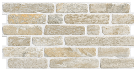
CARAVISTA QUARTZITE BEIGE 33x66