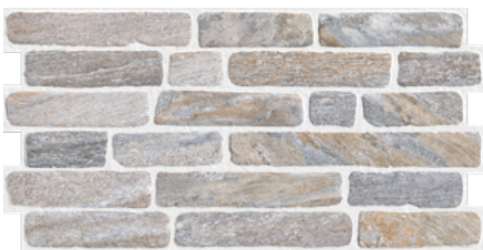
CARAVISTA QUARTZITE GREY 33x66