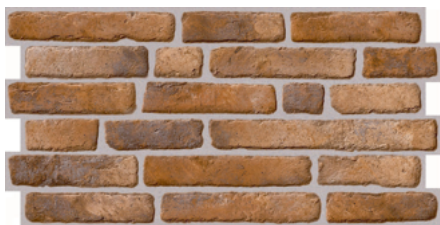
CARAVISTA 106 33x66