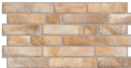
CARAVISTA 103 33x66