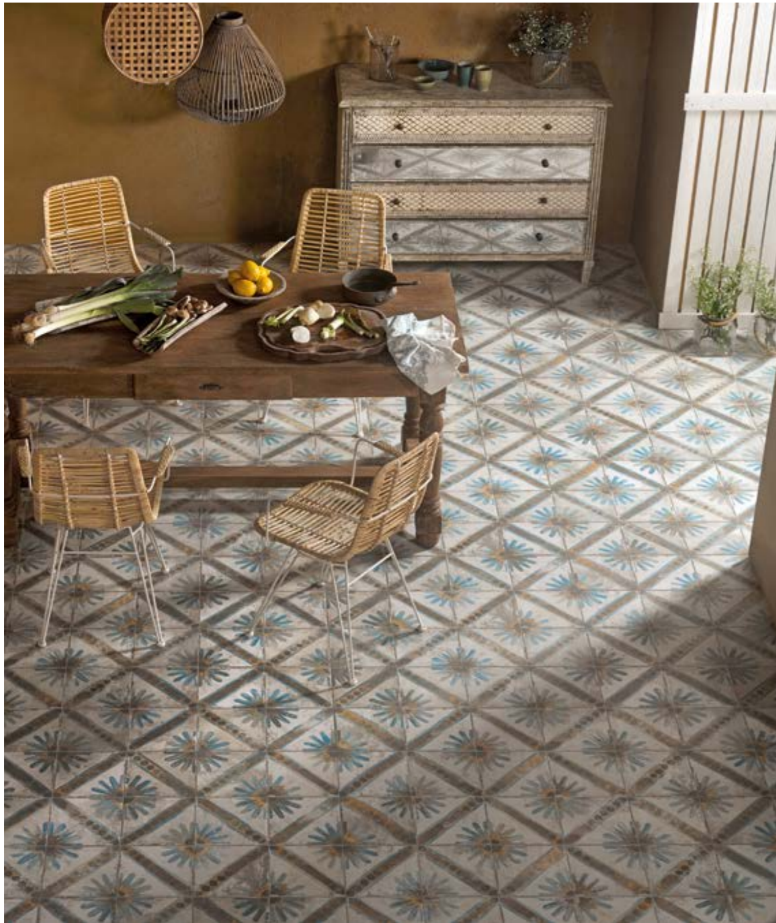
FS Marrakech Blue