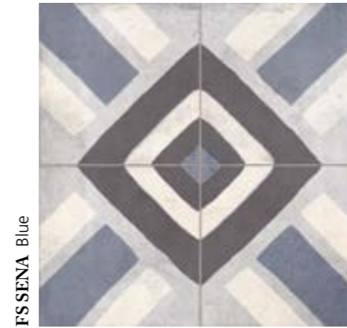
FS SENA Blue