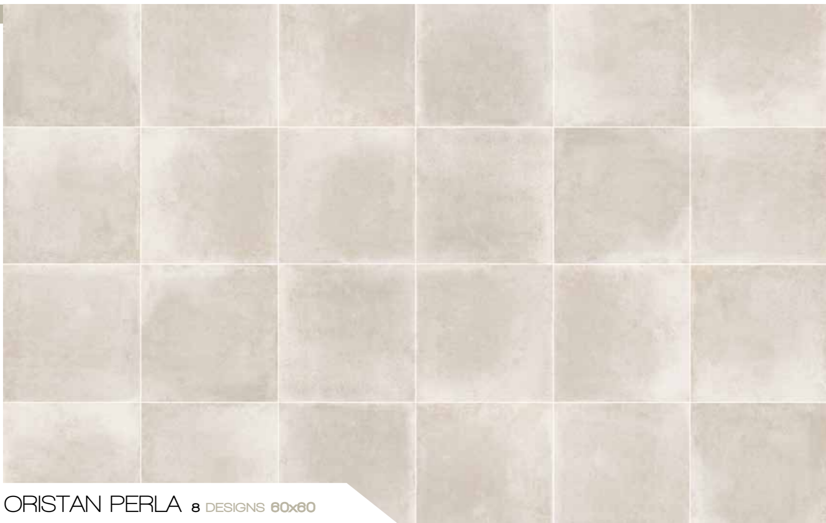
ORISTAN PERLA 8 DESIGNS 60x60