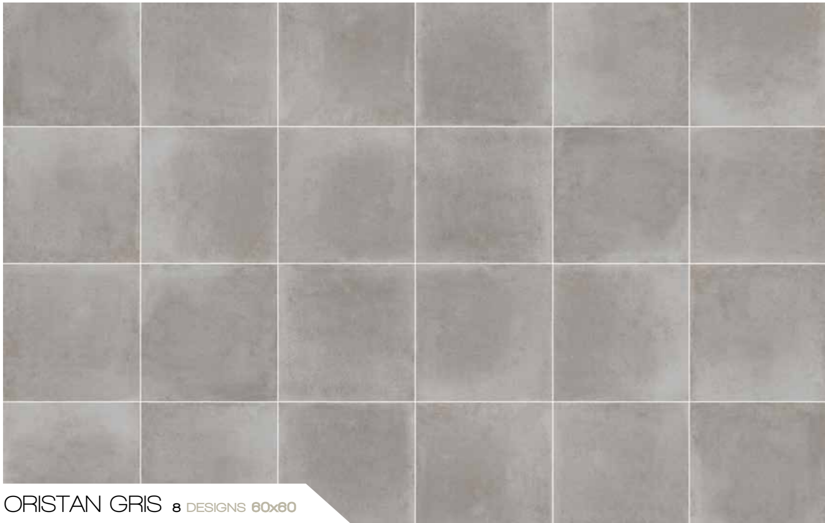
ORISTAN GRIS 8 DESIGNS 60x60