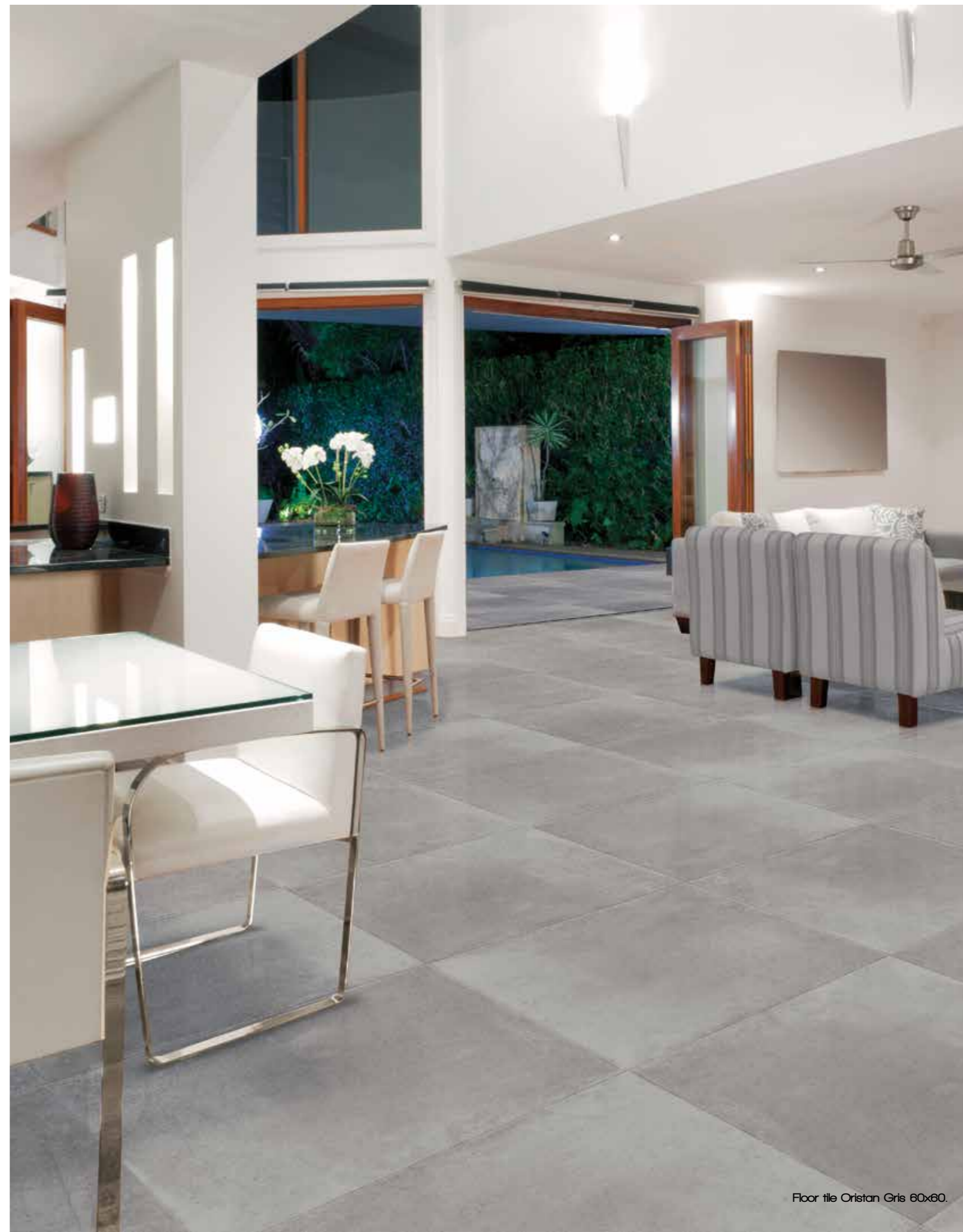
Floor tile Oristan Gris 60x60.