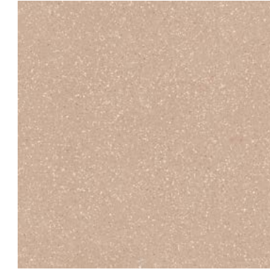
34782 EVOQUE CLAY SP/90X90/C/R Q48 (90x90 cm — 357/16x357/16*) 12 patterns * 133 Mapei