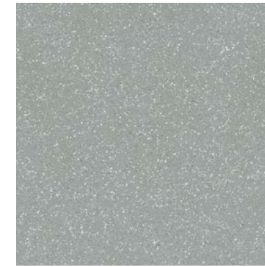
34783 EVOQUE GREEN SP/90X90/C/R Q48 (90x90 cm — 357/16x357/16*) 12 patterns * 112 Mapei