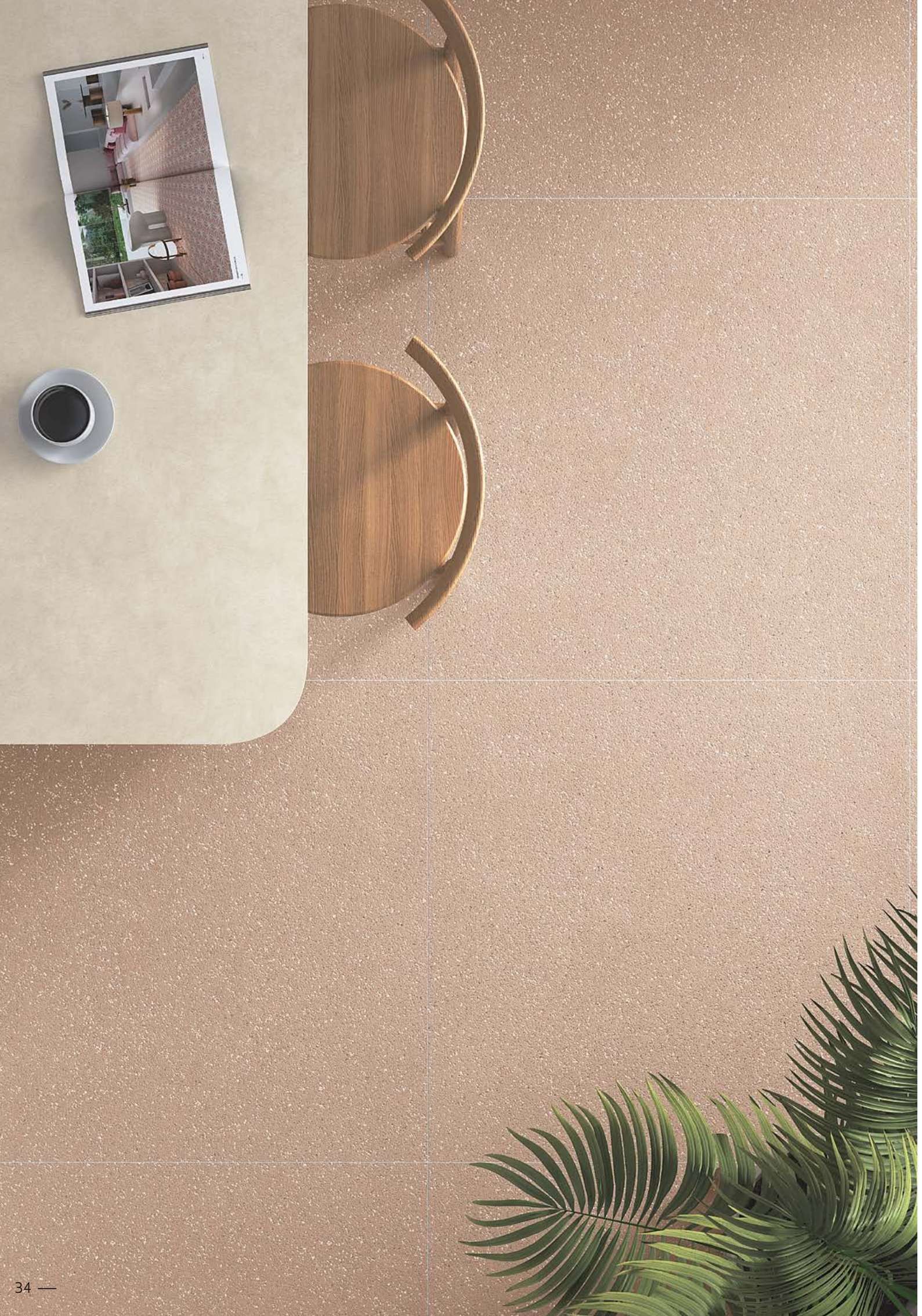
● EVOQUE CLAY SP/90X90/C/R