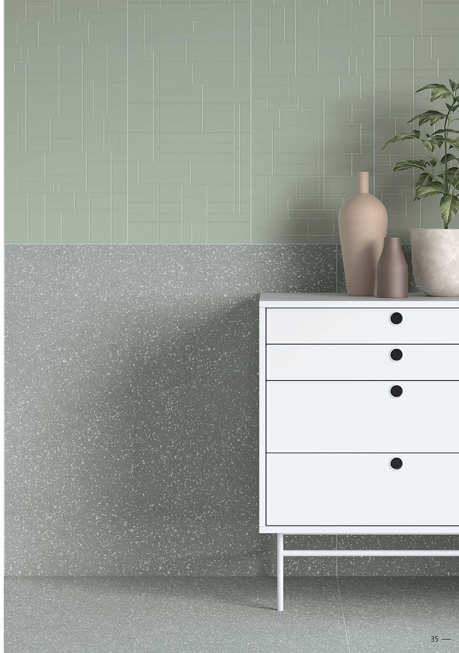
● EVOQUE GREEN SP/90X90/C/R