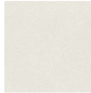
34779 EVOQUE WHITE SP/90X90/C/R Q48 (90x90 cm — 357/16x357/16*) 12 pattern * 110 Mapei