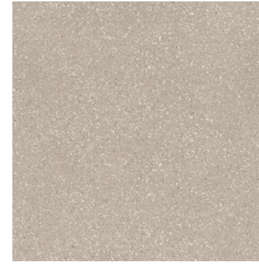
34780 EVOQUE TAUPE SP/90X90/C/R Q48 (90x90 cm — 357/16x357/16*) 12 patterns * 133 Mapei