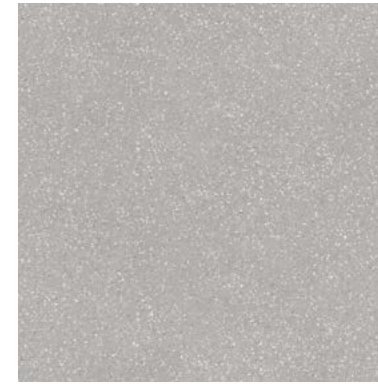
34781 EVOQUE GREY SP/90X90/C/R Q48 (90x90 cm — 357/16x357/16*) 12 patterns * 112 Mapei