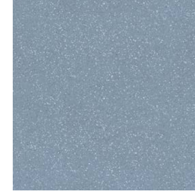
34784 EVOQUE BLUE SP/90X90/C/R Q48 (90x90 cm — 357/16x357/16*) 12 patterns ** 14 Kerakoll