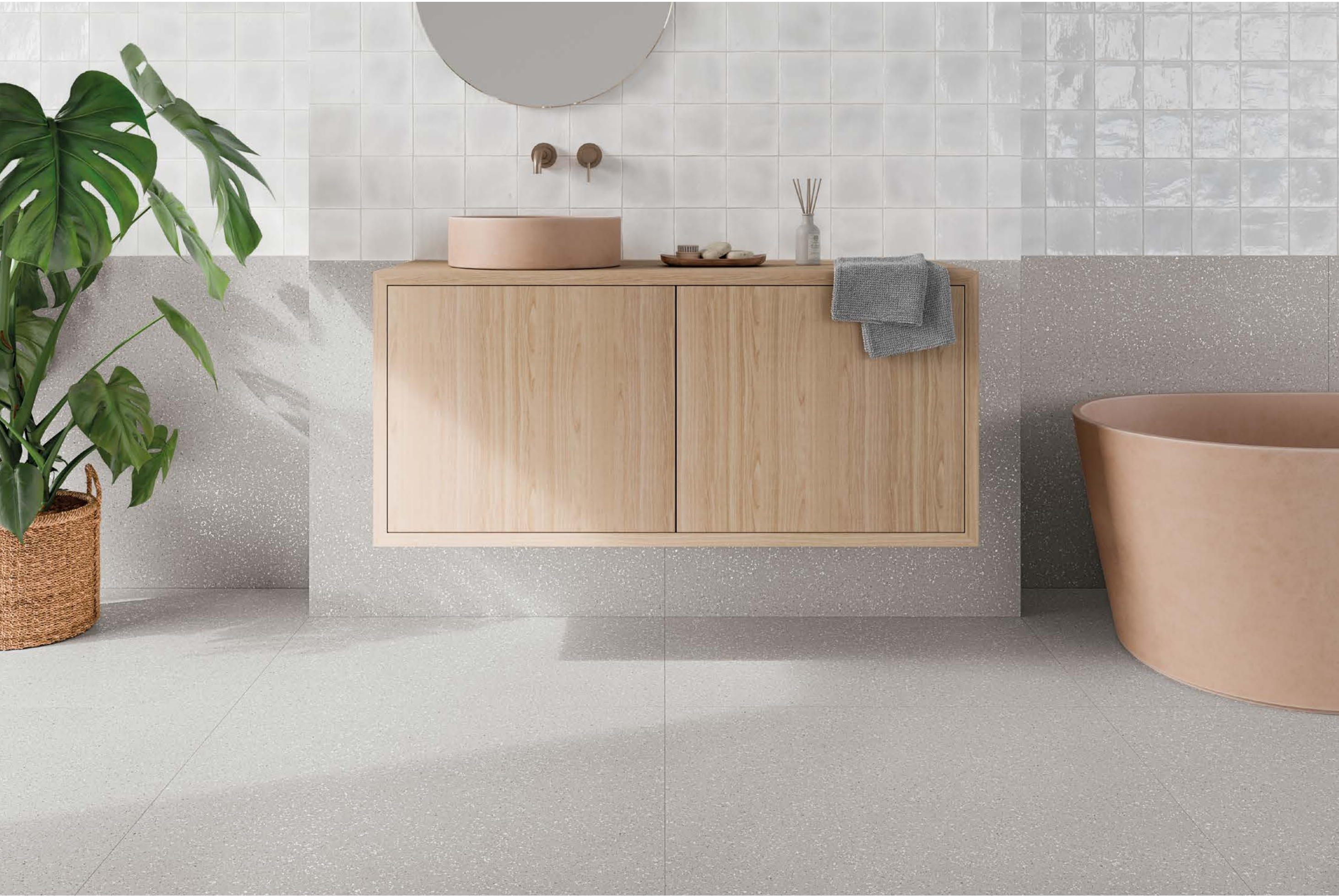
● NADOR WHITE /13.2X13.2 ● EVOQUE GREY SP/90X90/C/R